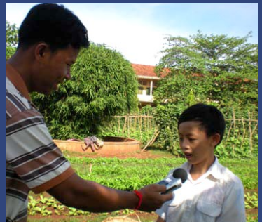
អ្នកទទួលបានជ័យជំនះក្នុងកម្មវិធីក្រុមសិស្សយកព័ត៌មានមានភាពព្យាបាទ ក្នុងការបង្ហាញពីភាពជោគជ័យរបស់ខ្លួន

សិស្សទី៣ដែលទទួលបានជ័យជំនះក្នុងកម្មវិធីប្រកួតប្រជែងអ្នកយកព័ត៌មានបានបង្ហាញអំពីបច្ចេកទេសផ្ទាល់ខ្លួន ។ គេត្រូវបានគេមើលរំលងស្រើសប្រធានបទ និងធ្វើការសហការដើម្បីផលិតកម្មវិធីព័ត៌មានដោយខ្លួនឯង ។ គេផលិតដោយខ្លួនឯង និងធ្វើការសម្ភាសន៍ជាមួយអ្នកពាក់ព័ន្ធជាជា នាយកសាលា គ្រូបង្រៀន មិត្តរួមថ្នាក់ និងសមាជិកក្រុមអ្នកស្តាប់ អ្នកទទួលបានជ័យជំនះជាសិស្សមធ្យមសិក្សាមកពីវិទ្យាល័យ ហាស ប៊ើស២ ។