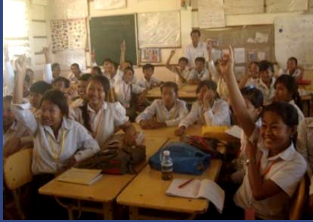
ការចូលរួមពីសិស្សមានកម្រិតខ្ពស់ ៖ សិស្សក្នុងក្រុមអ្នកស្តាប់ ផ្តល់ព័ត៌មានត្រឡប់

ដៃគូរបស់ IBEC អង្គការ Equal Access បានកំពុងអនុវត្តគ្រប់ផែនការសកម្មភាពទាំងអស់របស់ខ្លួន ក្នុងការជួយ IBEC ដើម្បីផ្សព្វផ្សាយព័ត៌មាន និងដំណឹងស្តីអំពីអន្តរាគមន៍របស់គម្រោង ។ EA បានរៀបចំកម្មវិធីបំណិនជីវិតតាមវិទ្យុដែលហៅថាកម្មវិធី យើងអាចធ្វើបាន និងសកម្មភាពចូលរួមពីសហគមន៍ សកម្មភាពសំខាន់ៗមួយចំនួនត្រូវបានបញ្ចប់ក្នុងត្រីមាសនេះរួមមាន ការបង្កើតមតិការសម្រាប់ផលិតកម្មវីដេអូ និងផ្សព្វផ្សាយ ការផ្តល់នូវទិន្នន័យតាមដានសម្រាប់ក្រុមអ្នកស្តាប់ និងក្រុមសិស្សសន្តោស ។ នៅដើមត្រីមាសនេះ EA បានរៀបចំដំណើរការផលិតកម្មវីដេអូបំណិនជីវិតតាមវិទ្យុមួយ ជាមួយនឹងការពិនិត្យឡើងវិញនូវព័ត៌មានត្រឡប់ដែលបានមកពីទស្សនិកជនតាមរយៈកម្មវិធីសំនួរចម្លើយ ជាពិសេសគឺក្រុមអ្នកស្តាប់ដែលពួកគេបានចូលរួមស្តាប់ចាប់តាំងពីកម្មវិធីធ្វើការផ្សាយជាលើកដំបូងមកម្ល៉េះ ។