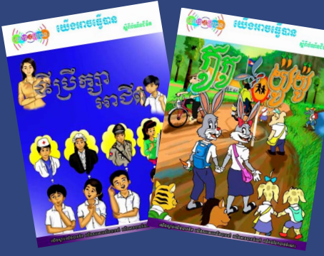
សៀវភៅតុក្កតា ៖ ទីប្រឹក្សាអាជីព (ឆ្វេង) បំណិនជីវិតធ្វើឱ្យ Coco និង Yoyo ទទួលបានប្រាក់ចំណូល (ស្តាំ)

ផ្នែកមួយនៃសកម្មភាពផ្សព្វផ្សាយរបស់ IBEC EA បានផលិតសៀវភៅតុក្កតា ដែលគ្រប់សៀវភៅទាំងអស់បានបង្ហាញពីប្រធានបទលើកឡើងក្នុងកម្មវិធីវិទ្យុ យើងអាចធ្វើបាន ដែលបានបញ្ចូលសារសំខាន់ៗពីរឿងខ្លីទាំងនោះផងដែរ ។ សៀវភៅតុក្កតាដែលមានភាពទាក់ទាញដែលធ្វើឡើងដើម្បីឱ្យមានការចូលរួម ការកំសាន្ត និងអប់រំយុវជនអំពីបំណិនជីវិតដែលបានពិភាក្សានៅក្នុងកម្មវិធីវិទ្យុ ។ ក្នុងត្រីមាសនេះ សៀវភៅតុក្កតាចំនួន២បានបញ្ចប់រួចរាល់ ដែលនិយាយអំពីប្រធានបទផែនការអាជីព និងបំណិនជីវិត ។ សៀវភៅសរុបជាង២០០០ក្បាលបានបែងចែកដល់សាលារៀនចំនួន១០១ ក្នុងខេត្តកំពង់ចាម សៀមរាប និងក្រចេះ ។