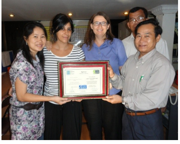
ថ្ងៃមោទនភាព អ្នកគ្រប់គ្រង និងទីប្រឹក្សាគម្រោងបង្ហាញវិញ្ញាបនបត្រទទួលស្គាល់ដែលបញ្ជាក់អំពី GPP

តាមរយៈសកម្មភាពកសាងសមត្ថភាពដ៏ធំទូលាយដែលដឹកនាំចាប់តាំងពីឆ្នាំ២០១០មក KAPE បានចាប់ផ្តើមរៀបចំដាក់ពាក្យស្នើសុំនៅដើមឆ្នាំ២០១១ ។ CCC បានពិនិត្យមើលដំណើរការនេះដោយតឹងតែងបំផុត ។ មានបីដំណាក់កាលក្នុងការទទួលបាននូវវិញ្ញាបនបត្រនេះគឺពាក់ព័ន្ធនឹង (i) ការពិនិត្យឯកសារ និងការស៊ើបអង្កេត (ii) ដំណើរការពិនិត្យបញ្ជាក់ឡើងវិញ និង (iii) ការពិនិត្យមើលពីខាងក្រៅ និងការផ្តល់ដំណាក់កាលចុងក្រោយនៃដំណើរការទទួលស្គាល់នេះក្នុងខែ កញ្ញា ២០១១ និងត្រូវបានជូនដំណឹងអំពីការទទួលស្គាល់ពេញលេញរបស់ខ្លួនដោយ CCC ក្នុងសប្តាហ៍ទី៣នៃខែ កុម្ភៈ ២០១២ ។ ក្នុងនាមជាអង្គការក្នុងស្រុកធំបំផុតដែលធ្វើការលើវិស័យអប់រំក្នុងប្រព័ន្ធការទទួលស្គាល់នាពេលថ្មីៗចំពោះអង្គការ KAPE បានបង្កើតសមត្ថភាពយ៉ាងខ្លាំងដល់មូលដ្ឋានលើការអភិវឌ្ឍន៍វិស័យ ។ លទ្ធផល