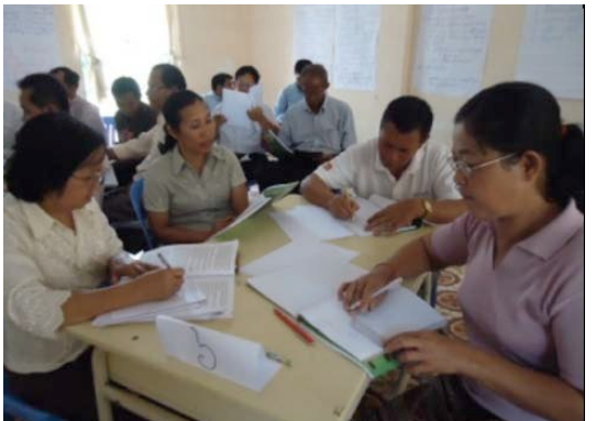
គ្រូឧទ្ទេស និង DPO ធ្វើការជាក្រុមតូចដើម្បីរៀបចំផែនការសកម្មភាពក្នុងសិក្ខាសាលាគ្រប់គ្រងសាលារៀន និងភាពជាអ្នកដឹកនាំលើកទី៤ ក្នុងខេត្តសៀមរាប

សកម្មភាពក្នុងត្រីមាសនេះគឺការបណ្តុះបណ្តាលលើកទី៤ និងបញ្ចប់នូវសិក្ខាសាលាបំប៉នលើការគ្រប់គ្រងសាលារៀន និងភាពជាអ្នកដឹកនាំដែលធ្វើឡើងក្នុងខេត្តទាំង៣ ។ សិក្ខាសាលាបានចូលរួមដោយបុគ្គលិករដ្ឋបាលសាលារៀនមកពីសាលារៀនគោលដៅរបស់ IBEC ដែលនាំមកនូវការពិគ្រោះយោបល់ទៅលើការដោះស្រាយបញ្ហាដោយមានហេតុផលដើម្បីធ្វើឱ្យប្រសើរឡើងនូវការគ្រប់គ្រង និងការត្រួតពិនិត្យទៅលើការវិនិយោគផ្សេងៗដែលបានធ្វើឡើងក្នុងសាលារៀនរបស់ពួកគេ ។ សិក្ខាសាលាក៏បានពិភាក្សាផងដែរលើប្រធានបទដូចជា ភាពចាំបាច់នៃទស្សនវិស័យរបស់សាលា របៀបវារៈប្រកួតប្រជែងជាមួយសហគមន៍ និងការសាកល្បងដោះស្រាយបញ្ហាដោយវិភាគ សិក្ខាសាលាដែលធ្វើឡើងក្នុងត្រីមាសនេះត្រូវបានចូលរួមដោយបុគ្គលិករដ្ឋបាលសាលារៀនចំនួន៣៤២នាក់ ។ ដើម្បីឱ្យមាននិរន្តរភាពខ្ពស់សម្រាប់សកម្មភាពកសាងសមត្ថភាពនេះ សិក្ខាសាលាបានដឹកនាំដោយគ្រូឧទ្ទេសចំនួន៣១នាក់មកពីក្រសួងអប់រំដែលធ្វើការជ្រើសរើសចេញពីមន្ទីរអប់រំខេត្ត និងការិយាល័យអប់រំស្រុក ។ គ្រូឧទ្ទេសទាំងអស់បានចូលរួមវគ្គបណ្តុះបណ្តាលគ្រូឧទ្ទេសចំនួន៣ថ្ងៃក្នុងខេត្តសៀមរាបក្នុងគោលបំណងដើម្បីរៀបចំសម្រាប់វគ្គសិក្ខាសាលាធំ ។ ការបណ្តុះបណ្តាលគ្រូឧទ្ទេសរួមមានការទស្សនកិច្ចទៅកាន់សាលារៀនគ្រប់ក្នុងខេត្តសៀមរាប ដើម្បីទស្សនាផ្ទាល់អំពីការអនុវត្តលើការគ្រប់គ្រងជាក់ស្តែង អ្នកចូលរួមក្នុងសិក្ខាសាលាទាំង៤៩គ្រូនឹងឈានទៅដល់ការផ្តល់វិញ្ញាបនបត្រ ផ្នែកទៅលើការពិនិត្យឡើងវិញអំពីការចូលរួមក្នុងវគ្គសិក្ខាសាលា និងបញ្ចប់ការងារដែលបានកំណត់នៅពេលដែលពួកគេត្រឡប់ទៅសាលារៀនរបស់ខ្លួនវិញ ។