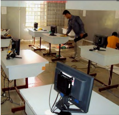
បន្ទប់កុំព្យូទ័រថ្មីតម្កើងក្នុងខេត្តកំពង់ចាម៖ គម្រោងបានបង្កើតគំរូកុំព្យូទ័រថ្មីដើម្បីការពារទឹកជំនន់ជាពិសេសចំពោះសាលាដែលងាយរងគ្រោះ

ក្រុមបុគ្គលិក IT បានបញ្ចប់ការដំឡើងបន្ទប់កុំព្យូទ័រថ្មីចំនួន៤ក្នុងត្រីមាសនេះ ដែលជាផ្នែកមួយនៃផែនការក្នុងឆ្នាំទី៣ក្នុងការដំឡើងបន្ទប់កុំព្យូទ័រសរុបចំនួន៨ (២បន្ទប់ជាថវិកាបដិភាគពីមូលនិធិ Oaktree) ក្នុងនោះ៥បន្ទប់ត្រូវបានដំឡើងក្នុងខេត្តកំពង់ចាម និង៣បន្ទប់ទៀតដំឡើងនៅក្នុងខេត្តសៀមរាប ក្នុងកិច្ចខិតខំប្រឹងប្រែងដើម្បីឱ្យមានការចូលរួមពីមន្ទីរអប់រំខេត្តក្នុងដំណើរការនេះ IBEC បានធ្វើការជាមួយក្រុមការងារគ្រោះយោបល់ថ្នាក់ខេត្តដើម្បីកំណត់ និងជ្រើសរើសសាលារៀនដែលត្រូវទទួលបានបន្ទប់កុំព្យូទ័រ ។ សរុបទាំងបន្ទប់កុំព្យូទ័រដែលបានផ្តល់តាំងពីគម្រោងបានចាប់ផ្តើមមក USAID បានជួយគាំទ្របន្ទប់កុំព្យូទ័រសរុបចំនួន៣៤ហើយរហូតដល់ចុងឆ្នាំនេះ ។ តាមការអនុវត្តកម្មវិធី បន្ទប់កុំព្យូទ័រដែលបានដំឡើងរួចរាល់ហើយក្រុមបុគ្គលិក IT បានផ្តល់វគ្គបំប៉នទៅលើការប្រើប្រាស់ទៅតាមមុខវិជ្ជា លោកគ្រូអ្នកគ្រូបានចំណាយពេលវេលាបន្ថែមដើម្បីបង្រៀនកុំព្យូទ័រដល់សិស្ស ។ ឆ្នាំនេះគ្រូ IT សរុបចំនួន២៤នាក់ត្រូវបានជ្រើសរើសដើម្បីទទួលវគ្គបំប៉ន ។ IBEC ក៏បានធ្វើកំណែទៅលើឯកសារទស្សនៈទានស្តីអំពីសាលាធនធានផ្នែកបច្ចេកវិទ្យា និងបានដាក់សំណើជូនក្រសួងអប់រំ ។ ការស្នើឡើងក្នុងការបង្កើតសាលាធនធានផ្នែកបច្ចេកវិទ្យានេះគឺធ្វើឡើងដើម្បីអភិវឌ្ឍភាពជាដៃគូរវាងករណី និងរដ្ឋជាមួយក្រុមហ៊ុន Microsoft ក្រសួងអប់រំបាននឹងកំពុងពិនិត្យទៅលើសំណើសុំនេះដើម្បីឱ្យស្របទៅនឹងគោលនយោបាយ ICT របស់ក្រសួងអប់រំ និងសន្យាថាផ្តល់ការឆ្លើយតបទៅលើសំណើក្នុងពេលឆាប់ៗ ។