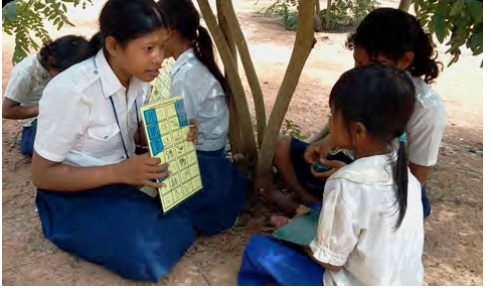
ជួយគ្នាក្នុងការរៀនសូត្រ ៖ សិស្សធំបង្រៀនសិស្សតូចក្នុងខេត្តកំពង់ចាម

សកម្មភាពដ៏សំខាន់ក្នុងត្រីមាសនេះគឺការពិនិត្យឡើងវិញ និងអនុម័តផែនការអភិវឌ្ឍសាលារៀនទាំងអស់ដែលបានឆ្លើយតបកម្រិតចំនួន៦១ និងសាលាមធ្យមចំនួន៩៨ ដើម្បីចូលរួមក្នុងគម្រោង ។ សាលារៀនត្រូវបានលើកទឹកចិត្តឱ្យកំណត់ជ្រើសរើសនូវបញ្ហាដែលជួបប្រទះដោយខ្លួនឯង បន្ទាប់មករៀបចំផែនការសកម្មភាពដោយដកចេញពីមុខយើងសេវាកម្មដែលរៀបចំដោយ IBEC ដោយផ្អែកលើសមាសភាគទាំង៦របស់សាលាកុមារមេត្រីនៃក្រសួងអប់រំ ។ មានការសម្រេចចិត្តផ្សេងៗគ្នាក្នុងការជ្រើសរើសសកម្មភាពដោយសាលាដែលបានចូលរួមបង្ហាញពីភាពដឹកនាំដោយខ្លួនឯងទៅលើគម្រោង នេះគឺជាផលចំណេញមួយ ។ ក្នុងចំណោមកម្រិតសាលាទាំងអស់មានការជ្រើសរើសសកម្មភាពខុសគ្នាចំនួន៥៣ប្រភេទដោយផ្អែកលើសមាសភាគទាំង៦របស់សាលាកុមារមេត្រីខណៈដែលមធ្យមសិក្សារើសយកសកម្មភាពចំនួន៦៤ផ្សេងៗគ្នា ។ ដោយមានការរើសយកសកម្មភាពផ្សេងៗក្នុងខេត្តទាំង៣ មន្ត្រីតាមមូលដ្ឋានបានបង្ហាញថាបឋមសិក្សាទាំងអស់នឹងអនុវត្តសកម្មភាពសរុបចំនួន១,៥០៣ ខណៈពេលដែលមធ្យមសិក្សានឹងអនុវត្តសកម្មភាពសរុបចំនួន៣,០៨៧ផ្សេងៗគ្នា ។ IBEC នឹងផ្តល់ថវិកាគាំទ្រផ្ទាល់ដល់សាលារៀនទាំងអស់ដើម្បីអនុវត្តសកម្មភាពទាំងនោះសរុបចំនួន ២៩០,៨៥០ ដុល្លារអាមេរិក ។