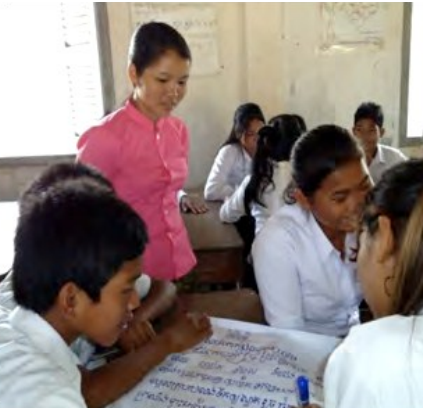
ការសិក្សាដោយប្រសិទ្ធភាពគឺជាប្លុកគល់៖ គ្រូកុមារមេត្រីមធ្យមសិក្សាក្នុងខេត្តក្រចេះពិនិត្យមើលការងារក្រុមក្នុងថ្នាក់របស់គាត់

ក្នុងការបង្រៀន និងរៀនដែលបង្កើតឡើងដោយក្រសួងអប់រំ បុគ្គលិក IBEC ជាមួយនឹងដៃគូក្រសួងរបស់ខ្លួនដឹកនាំការទស្សនកិច្ចតាមដានទៅកាន់កម្រងសាលាជាច្រើនដើម្បីផ្តល់នូវការជួយគាំទ្របច្ចេកទេសបន្ថែម និងធ្វើការចែកចាយសម្ភារៈឧបទ្វេស ។ សមាសភាគនេះក៏បានបញ្ចប់ផងដែរនូវការបំប៉នបន្ថែមដល់គ្រូចំនួន ៥១នាក់ (ស្រី២០នាក់) ក្នុងការបង្កើតក្តីបមុខវិជ្ជាដើម្បីជួយសិស្សក្នុងការបង្កើតនូវចំណាប់អារម្មណ៍ពិសេសដូចជាប្រវត្តិសាស្ត្រ និងនិរន្តរភាពវិទ្យាសាស្ត្រ ។ ក្តីបច្ចុប្បន្ន៦៧នាក់ពី៥៧សាលារៀនបានដឹកនាំដោយសិស្សខ្លួនឯង ប៉ុន្តែត្រូវបានទទួលការសម្របសម្រួលពីគ្រូ ។ IBEC ក៏បានបញ្ចប់សិក្ខាសាលារយៈពេល៤ថ្ងៃផងដែរស្តីអំពីការបង្កើតឯកសារពិសោធន៍វិទ្យាសាស្ត្រសម្រាប់គ្រូចំនួន៣៧នាក់ដោយប្រើសៀវភៅធនធានដែលអភិវឌ្ឍដោយគម្រោងកាលពីឆ្នាំមុន សិក្ខាសាលានេះធ្វើឡើងដើម្បីផ្តល់ការបំប៉នគរុកោសល្យដល់គ្រូវិទ្យាសាស្ត្រក្នុងសាលាដែលមានបន្ទប់ពិសោធន៍ថ្មី ជាពិសេសដើម្បីប្តូរពីការសិក្សាបែបទ្រឹស្តីទៅរកការសិក្សាបែបអនុវត្តផ្ទាល់ ។ ដោយស្ថានភាពខ្លះគ្រូនៅតែបន្តយ៉ាងធ្ងន់ធ្ងរ បុគ្គលិក IBEC បានធ្វើការជ្រើសរើស និងបំប៉នគ្រូសហគមន៍ថ្មីចំនួន៦៧នាក់ដែលនឹងត្រូវជួយដល់សាលារៀន និងតំបន់ដែលទទួលបានការបំប៉នច្រើន ។ ក្នុងករណីនៃការប្រើប្រាស់ បណ្តាញប្រសិទ្ធភាព IBEC ទើបនឹងបានសហការភាពជាដៃគូជាមួយអង្គការ See Beyond Borders ដែលនឹងត្រូវធ្វើការជាមួយគម្រោងដើម្បីលើកកម្ពស់បំណិនរៀនចំនួនក្នុងចំណោមគ្រូបឋមសិក្សាដូចជាតាមដាននូវអំឡុងពេលរបស់គ្រូជួយគាំទ្របច្ចុប្បន្ន ។ ការធ្វើតេស្តជាមូលដ្ឋានទៅកាន់ចំនួនសាលារៀនពីរ ឬបីក្នុងគោលបំណងតាមដានទៅលើការផ្លាស់ប្តូរ នូវបំណិនរៀនចំនួនដើម្បីបង្ហាញលទ្ធផលពីការបំប៉នកម្មវិធីវិទ្យា និងគាំទ្រដោយ SBB ។