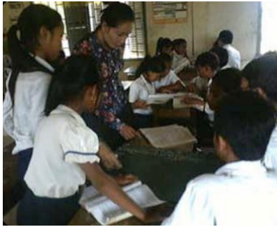
លទ្ធផលក្នុងថ្នាក់ : គ្រូបានបោះបង់ចោលវិធីសាស្ត្រ បង្រៀនដោយការសរសេរលើក្តារខៀន និងនិយាយ

ការចុះវាយតម្លៃគ្រូដោយបុគ្គលិករបស់ IBEC ត្រូវបានបញ្ចប់ ហើយលទ្ធផលបានបង្ហាញថា គ្រូភាគច្រើនមានលទ្ធភាពក្នុងការ គ្រប់គ្រងថ្នាក់រៀន និងប្រើវិធីសាស្ត្រក្នុងការបង្រៀន និងរៀនបាន យ៉ាងមានប្រសិទ្ធភាព ។ ការវាយតម្លៃជាទូទៅបានរកឃើញថាគ្រូ កុមារមេត្រីកម្រិតមធ្យមចំនួន៩០% គ្រូកុមារមេត្រីថ្នាក់បឋមចំនួន ៩៥% និងគ្រូសហគមន៍ចំនួន៧៤% ទទួលបានការវាយតម្លៃគួរឱ្យ ពេញចិត្ត ។ ជាលទ្ធផលវិជ្ជមានគឺយើងមានគ្រូជំនួយពីភាសាជួយ សម្របសម្រួលក្នុងពេលបង្រៀន សិស្សចំនួន ៨០៨នាក់ក្នុង ចំណោមសិស្ស៩០៨នាក់ក្នុងថ្នាក់ដែលមានគ្រូជំនួយពីភាសាត្រូវ បានឡើងថ្នាក់ក្នុងពេលបញ្ចប់ត្រីមាសនេះ ។