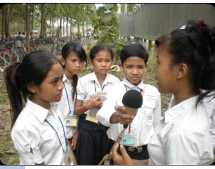
ក្រុមសិស្សចុះយកព័ត៌មានធ្វើសម្ភាសមិត្តរួមថ្នាក់ក្នុងសហគមន៍របស់ពួកគេ

ដៃគូគម្រោង IBEC អង្គការ Equal Access (EA) បានបញ្ចប់ផែនការធំមួយស្តីអំពីសកម្មភាពផ្សព្វផ្សាយតាមរយៈប្រព័ន្ធផ្សព្វផ្សាយផ្សេងៗក្នុងត្រីមាសនេះ ។ សិស្សបានចូលរួមស្តាប់កម្មវិធីវិទ្យុចំនួនពីរទៅ១០ កម្មវិធីក្នុងឆ្នាំនេះ និងចូលរួមកម្មវិធីសំនួរចម្លើយតាមរយៈកម្មវិធីវិទ្យុដែលបានផ្សាយលើកទី៩ និងទី១០ អានសៀវភៅកុក្កតាទី៣ និងទី៤ និងសកម្មភាពនៅក្នុងសាលារៀនជា