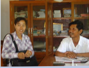
អ្នកគ្រូសុខុមនិយាយជាមួយលោកនាយកអំពីវិធីសាស្ត្រជួយកុមារី