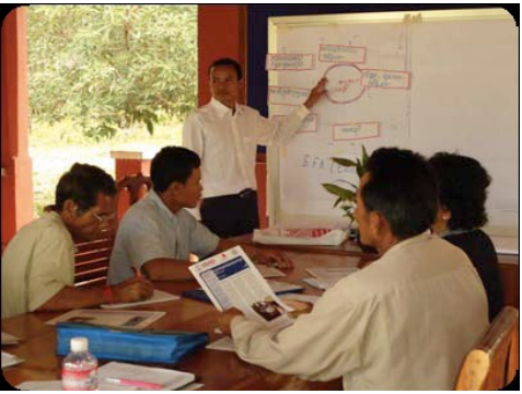
ការបង្កការចូលរួមពីសហគមន៍ ៖ សមាជិកCEFAC រៀនអំពីការអភិវឌ្ឍ

IBEC បានពង្រឹងសកម្មភាពកសាងសមត្ថភាពកណៈកម្មាធិការអប់រំសម្រាប់ទាំងអស់គ្នាថ្នាក់ឃុំ (CEFAC) របស់ខ្លួនក្នុងគោលបំណងប្តូរឥរិយាបថក្រុមប្រឹក្សាឃុំក្នុងការផ្តល់ថវិកាបដិភាគសម្រាប់សាលារៀនដើម្បីអនុវត្តកម្មវិធីរបស់គម្រោងក្នុងឆ្នាំ ២០១៣ ។ ឯកសារណែនាំដែលជួយដល់ឃុំគោលដៅទាំងអស់ត្រូវបានបោះពុម្ពក្នុងត្រីមាសនេះ ។