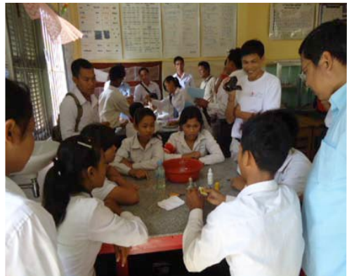
ការលើកកម្ពស់ការយល់ដឹងផលប៉ះពាល់របស់គម្រោង ៖ អង្គការ NEP មើលការពិសោធន៍ក្នុងសាលារៀន

IBEC នៅក្នុងខេត្តសៀមរាបដើម្បីមើលសកម្មភាពដែលអនុវត្តល្អមួយចំនួន ។ នៅថ្ងៃទី ២២ ខែ មិថុនា បុគ្គលិកមកពីអង្គការក្រៅរដ្ឋាភិបាលចំនួន៤០បានធ្វើទស្សនកិច្ចសិក្សាទៅកាន់សាលារៀនចំនួន២គឺអនុវិទ្យាល័យ សាមគ្គី និងបឋមសិក្សាហ៊ុនសែនគំរូស្ថិតក្នុងស្រុកជីវ្រៃ ។ ដំណើរទស្សនកិច្ចនេះធ្វើឡើងដើម្បីបញ្ជាក់បន្ថែមអំពីសិក្ខាសាលាដោយផ្តល់នូវឧទាហរណ៍ជាក់ស្តែងអំពីសកម្មភាពមួយចំនួនដែលបានពិភាក្សាអំឡុងពេលសិក្ខាសាលា ។ ភ្ញៀវបានមើលសកម្មភាពមួយចំនួនដូចជា ការប្រើប្រាស់បន្ទប់កុំព្យូទ័រ ការប្រើប្រាស់បន្ទប់ពិសោធន៍ សកម្មភាពបំណិនជីវិតមាន ការចិញ្ចឹមត្រី ដំណាំបន្លែ និងសកម្មភាពក្រុមប្រឹក្សាកុមារក៏ដូចជាបន្ទប់មុខវិជ្ជាជាដើម ។ ទស្សនកិច្ចនេះទទួលបានលទ្ធផលជោគជ័យដោយសារមានចំណាប់អារម្មណ៍លើការយកទៅអនុវត្តបន្តនៅតាមខេត្ត និងគម្រោងផ្សេងៗទៀត ។