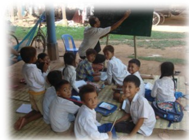
សកម្មភាពបំប៉នសិស្សរៀនយឺត