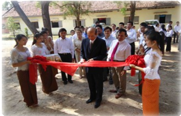
ឯកឧត្តម ណាត ប៊ុនរឿនកាត់ខ្សែប្រកួតពិធីសម្ពោធមណ្ឌលកុំព្យូទ័រ

IBEC បានរៀបចំពិធីសម្ពោធមណ្ឌលកុំព្យូទ័រ និងមណ្ឌលពិសោធន៍វិទ្យាសាស្ត្រនៅវិទ្យាល័យ សម្តេចឪក្នុងក្រុងសៀមរាប ។ ពិធីនេះចូលរួមដោយឯកឧត្តម ណាត ប៊ុនរឿន រដ្ឋលេខាធិការក្រសួងអប់រំ យុវជន និងកីឡា នាយិកាការិយាល័យសុខភាពសាធារណៈ និងអប់រំរបស់ USAID និងប្រធានមន្ទីរអប់រំយុវជន និងកីឡាខេត្តព្រះវិហារ