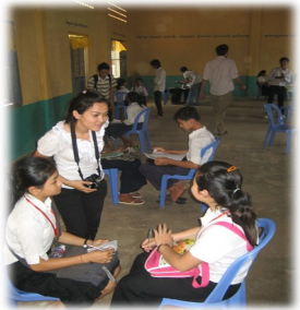
បុគ្គលិកទស្សនាវដ្តី LIFT កំពុងផ្តល់យោបល់ដល់សិស្សពីបច្ចេកទេសធ្វើសម្ភាស

ការស្វែងយល់ពីគោលបំណងនៃសកម្មភាពកសាងសមត្ថភាព ។ បច្ចុប្បន្ននេះនាយកសាលាកំពុងចូលរួមរៀបចំប័ណ្ណការងារគ្រប់គ្រងនិងភាពជាអ្នកដឹកនាំក្នុងអំឡុងពេល ២ ឆ្នាំ ហើយនឹងទទួលបានវិញ្ញាបនបត្របញ្ជាក់ការសិក្សាពីក្រសួងអប់រំ យុវជន និងកីឡា និងអង្គការអប់រំពិភពលោក ។